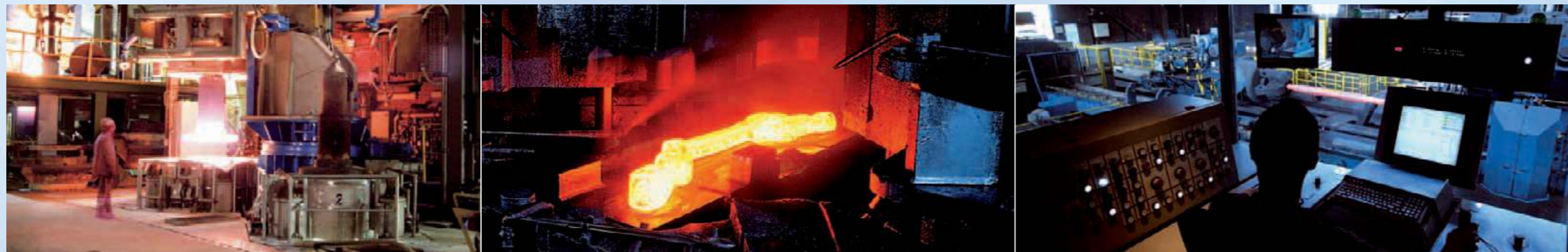
Leistung für unsere Kunden: ESU-Anlage (links); Gesenkschmiedeteil in der Produktion (Mitte); Prozesssteuerung im Schmiedeleitstand.

“ Kompetenz, Erfahrung und Wissen in Stahl. Damit sind wir in der Lage, jedem unserer Kunden den Stahl zu liefern, der ihn weiter bringt. Weltweit. In jeder Menge. Immer. So sichern wir unseren Markterfolg – und den unserer Kunden. “