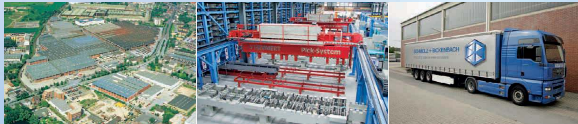
Eine der Säulen unserer Leistungsfähigkeit: die perfekte Logistik mit weltweiten Distributionsstandorten (links), modernster Lagertechnik (Mitte) und zuverlässiger just-in-time-Lieferung (rechts).

Unser Service an unseren Distributionsstandorten beginnt mit der technischen Beratung unserer Kunden in allen Fragen rund um das gewünschte Produkt. Die IT-Vernetzung unserer regionalen und zentralen Lager sowie in der Edelstahlproduktion gewährleistet dabei einen schnellen Datenaustausch, so dass alle erforderlichen Informationen in Sekundenschnelle zur Verfügung stehen. Er reicht weiter von der Übernahme der weiterführenden Bearbeitungsstufe unserer Erzeugnisse, das heißt dem Sägen, Anfasen, Zentrieren, Bohren, Fräsen, Brennschneiden, Scheren, Biegen, Abkanten, Bürsten und Schleifen, bis hin zu einbaufertigen Produkten, die just-in-time angeliefert und so direkt verwendet werden können. Ein Punkt, der speziell für die Automobilzuliefer-Industrie von zentraler Bedeutung ist: Für sie stellen Liefer- und damit eventuell verbundene Produktionsausfälle eine betriebswirtschaftliche Katastrophe, wenn nicht sogar existenzielle Bedrohung dar. Unsere Liefertreue ist mit Sicherheit einer der Hauptgründe, warum uns viele Unter-